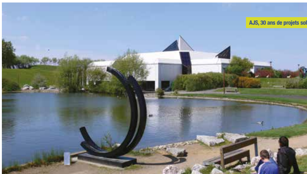
AJS, 30 ans de projets solidaires