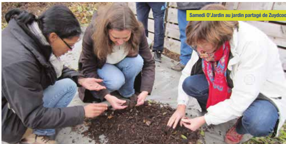
Samedi O'Jardin au jardin partagé de Zuydcoote