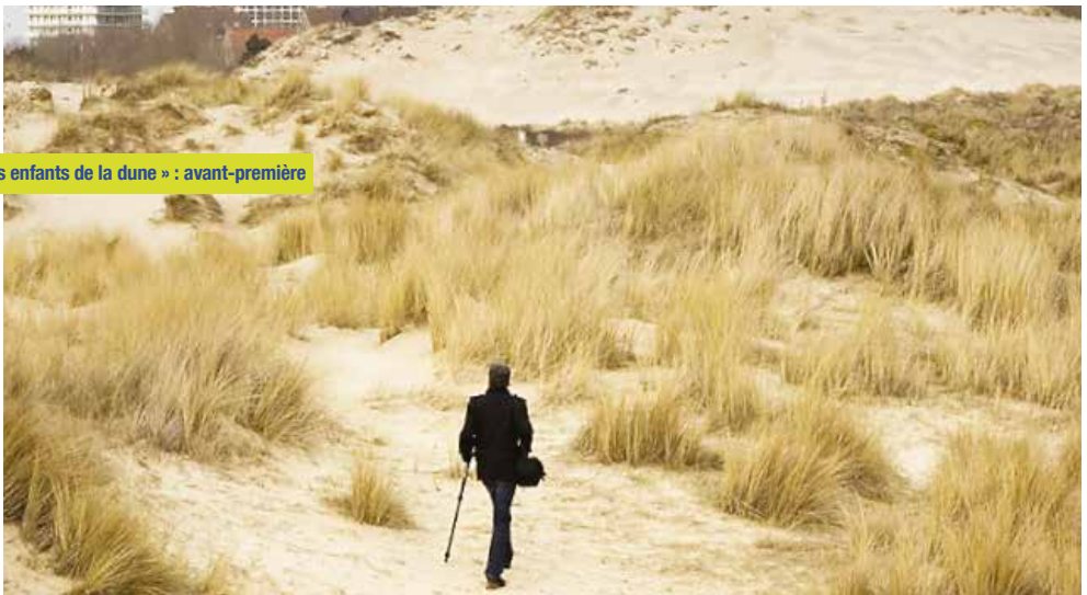
« Les enfants de la dune » : avant-première

Le documentaire part à la rencontre des habitants du littoral de la mer du Nord qui ont les dunes flamandes en héritage. Projet qui a pour thème l'attachement à un paysage originel : un bien commun aujourd'hui préservé. La projection sera suivie d'un débat en présence des réalisateurs.